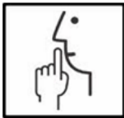
Rood Stil werken