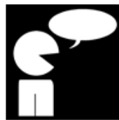
Groen Zachtjes praten