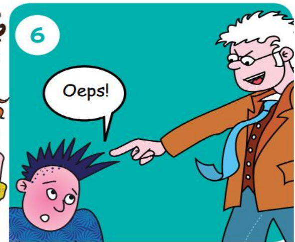
Ga naar je juf of meester. Die grijpt in.