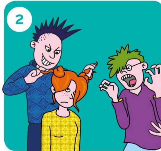
Gaat het door?