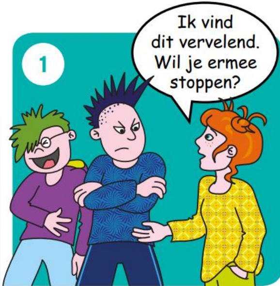
Zeg dat je het niet leuk vindt.