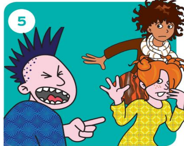
Gaat het door?