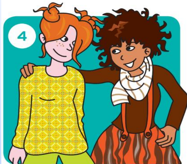
Stap naar je maatje of jouw maatje stapt naar jou.