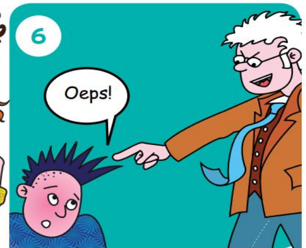
Ga naar je juf of meester. Die grijpt in.