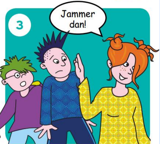
Ga iets anders doen.